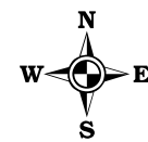
СХЕМА размещения искусственного земельного участка на водном объекте в акватории Воткинского водохранилища в Орджоникидзевском районе г. Перми